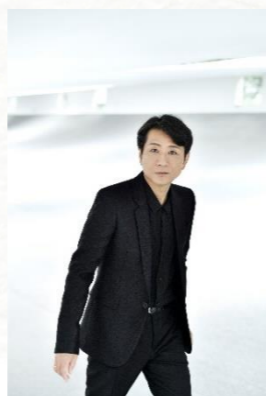
藤井フミヤ 十音楽団 TOON GAKUDAN

●主催：bayfm78 共催：市川市文化振興財団 問：ホットスタッフプロモーション 03-5720-9999 (平日12:00~18:00)