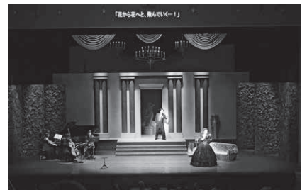
「オペラ『椿姫』市川オリジナル版」平成30年3月4日(日)