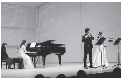
「ママも楽しい0歳からコンサート」平成29年11月13日(月)

コンクール受賞者は、受賞記念演奏会に出演後、市川市文化会館、行徳文化ホールI&I、芳澤ガーデンギャラリー、木内ギャラリー、アイ・リンク45階展望施設、市川市内各所さまざまな施設・会場での演奏会に出演していただいております。