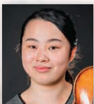
堀真亜菜 (ヴァイオリン)