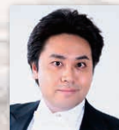
前川健生 (テノール)