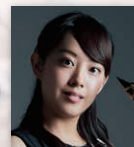
竹田歌穂 (サクソフォン)