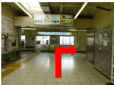
①改札を出たら右折し、階段を降ります。