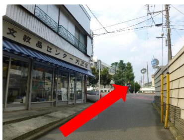
⑤交差点を直進し、真間川を渡ります。