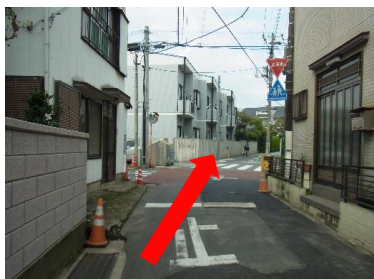
⑦交差点を直進します。