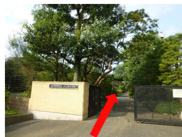
⑨右手に見えるのが当ギャラリーです。