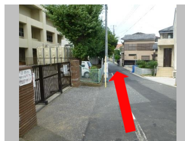
⑥真間小学校の裏門の道を直進します。