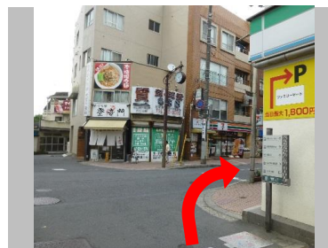
③コンビニエンスストアの角を右折し、突き当たりまで直進します。