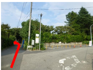
⑧駐車場の左の細い道に入ります。