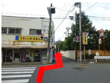
④正面の細い通りに入り、道なりに直進します。