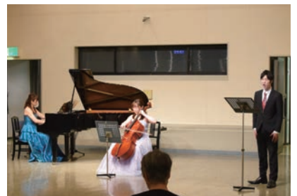
市川市文化会館 大会議室 午後のクラシック