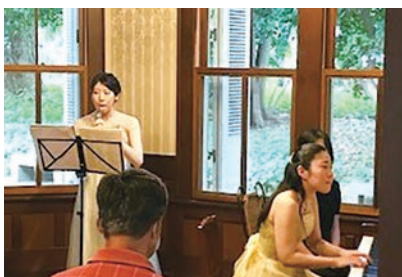
木内ギャラリー てこの森 木内邸音楽会