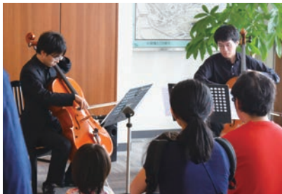
アイ・リンク45階展望施設 アイ・リンクスカイコンサート