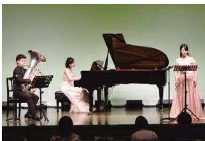
グリーンスタジオ ママも楽しい0歳からコンサート