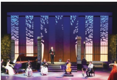
市川市文化会館 小ホール 真夏の饗宴