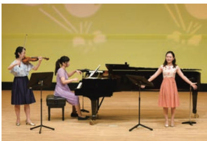
行徳文化ホールI&I ママも楽しい0歳からコンサート