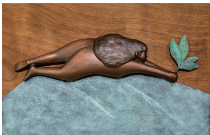
大地と人と:2019 ©桜井ただひさ

南米コロンビア各地にすむ原住民の文化に触れ、その壮大な世界観 / 宇宙観に惹かれています。