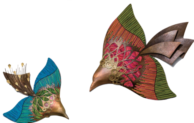
シャーマンの歌:2022年 ©桜井ただひさ