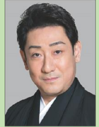
なかむら し かん 中村芝翫

僧 後 後 後 遍 狂 狂 狂 念 仔 仔 親 中 蓮 獅 獅 獅 村 蓮 言 言 言 松 蓮 子 子 子 之 之 之 之 之 江 助 助 助 翫