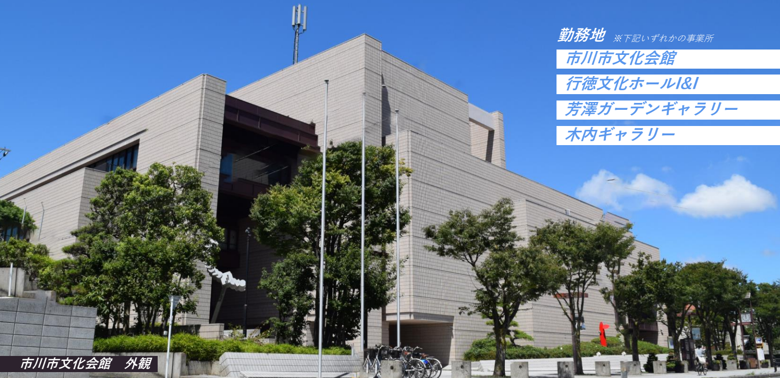
市川市文化会館 外観