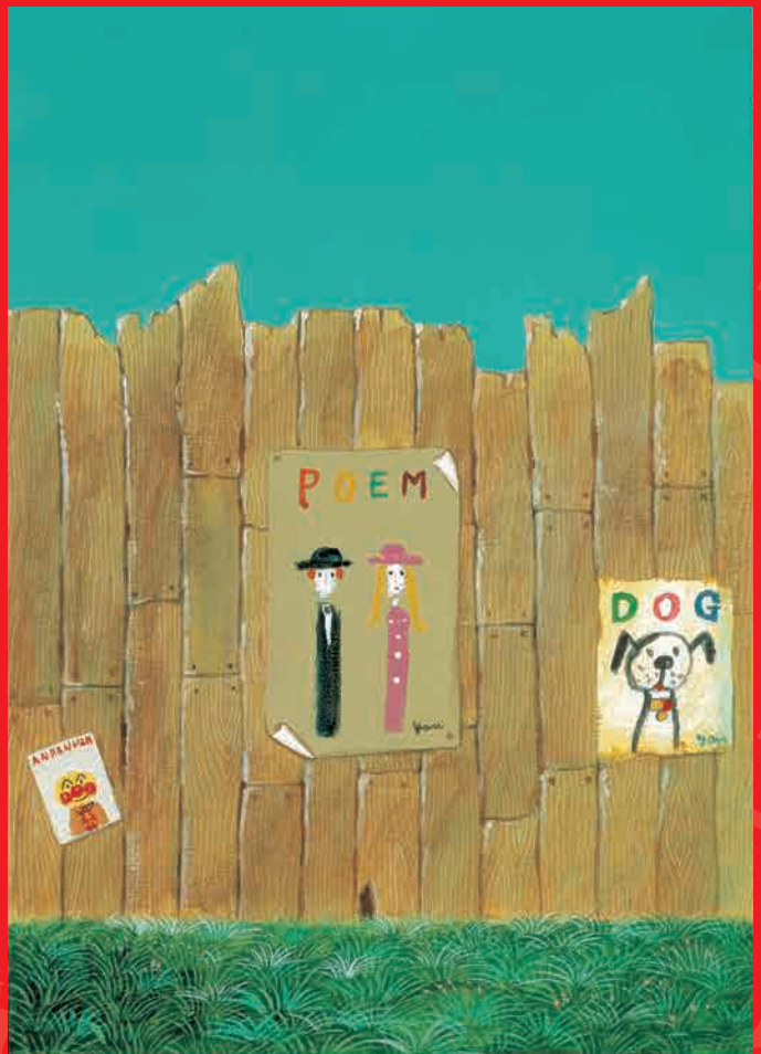
左上から 「アリスのさくらんぼ」「愛・LOVE・優」「やさしいライオン」 右上から 「やなせうさぎとアンパンマン」 「いちごえほん」サンリオ 1980年7月号表紙「ジャングルのかぜの7月号」 「詩とメルヘン」サンリオ 1996年6月号表紙「ポスターがすこしめくって草いきれ」 ©やなせたかし（公財）やなせたかし記念 アンパンマンミュージアム振興財団蔵