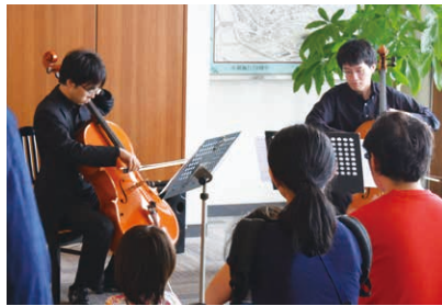
アイ・リンク45階展望施設 アイ・リンクスカイコンサート