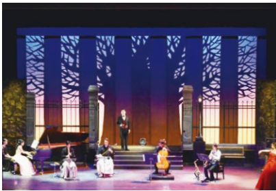
市川市文化会館 小ホール 真夏の饗宴