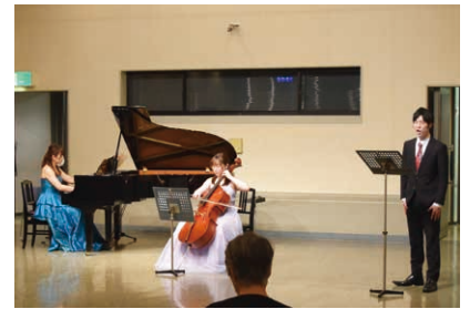
市川市文化会館 大会議室 午後のクラシック