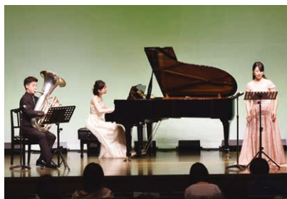
グリーンスタジオ ママも楽しい0歳からコンサート