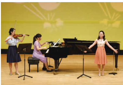
行徳文化ホールI&I ママも楽しい0歳からコンサート