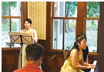
木内ギャラリー てこの森 木内邸音楽会