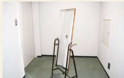
移動用姿見 利用可能数：2台 料金 (1台)：午前/165円/午後 220円/夜間 192円/全日 577円 ※使用される場合は、事務室にお声掛けください。