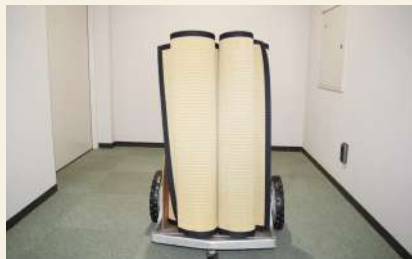
上敷 (小) 利用可能数：6畳2枚/3畳4枚 料金 (1枚)：午前 66円/午後 88円/夜間 77円/全日 231円 ※使用される場合は、事務室にお声掛けください。