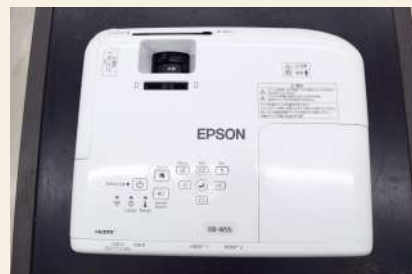
ビデオプロジェクター 要予約 メーカー・品番：EPSON EB-W55 利用可能数：1台 付属品：リモコン・HDMIケーブル・ワゴン 料金：午前 924円/午後 1,232円/夜間 1,078円/ 全日 3,234円 ※使用される場合は、事前にご連絡ください。