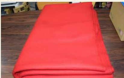
【落語セット】毛氈 (大) 3畳を超えるもの 利用可能数：2枚 料金 (1枚)：午前 165円/午後 220円/夜間 192円/ 全日 577円 ※使用される場合は、事務室にお声掛けください。