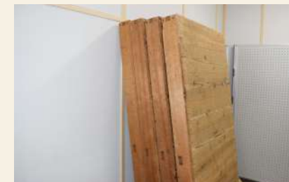
【落語セット】平台 (箱足・開き足を含む) 利用可能数：4枚 大きさ：3尺×6尺 料金 (1枚当たり)：午前 165円/午後 220円/夜間 192円/ 全日 577円