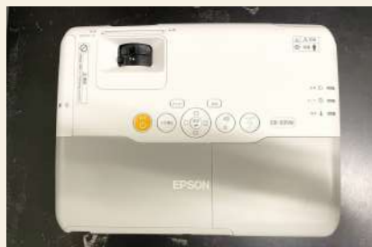
ビデオプロジェクター 要予約 メーカー・品番：EPSON EB-935W 利用可能数：2台 付属品：リモコン・HDMIケーブル・ワゴン 料金：午前 924円/午後 1,232円/夜間 1,078円/ 全日 3,234円 ※使用される場合は、事前にご連絡ください。