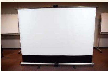
移動用スクリーン (大) 要予約 大きさ：141cm×220cm (自立式) 使用可能数：1台 ※第3・4・5会議室には備え付けのスクリーン有 料金：午前 66円/午後 88円/夜間 77円/全日 231円 ※使用される場合は、事前にご連絡ください。