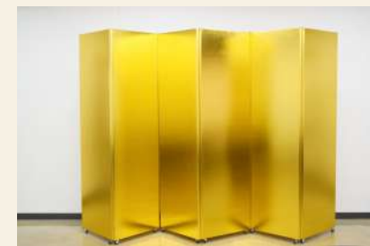
金屏風 要予約 利用可能数：1双 高さ：200cm 料金：午前 1,881円/午後 2,508円/夜間 2,194円/ 全日 6,583円 ※使用される場合は、事前にご連絡ください。