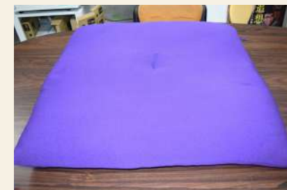
【落語セット】座布団 (高座用) 利用可能数：1枚 料金 (1枚)：午前 66円/午後 88円/夜間 77円/全日 231円 ※使用される場合は、事務室にお声掛けください。