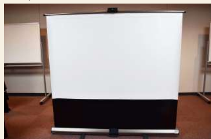
移動用スクリーン (小) 要予約 大きさ：117cm×180cm (自立式) 使用可能数：1台 ※第3・4・5会議室には備え付けのスクリーン有 料金：午前 66円/午後 88円/夜間 77円/全日 231円 ※使用される場合は、事前にご連絡ください。